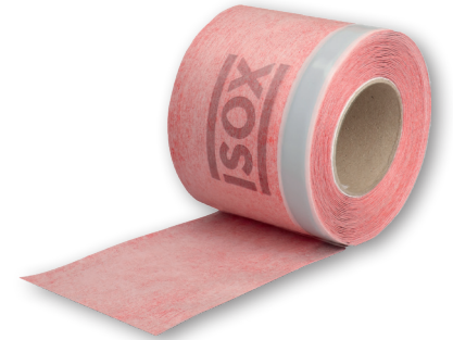
iSOX afdichtingsband douchebak