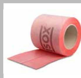
Bande d'étanchéité autoadhésive ISOX