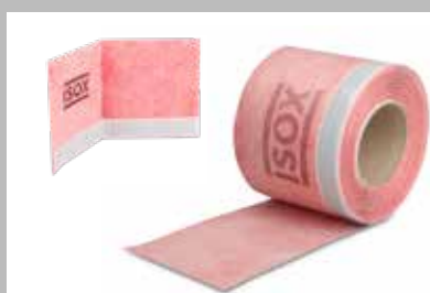
Bande d'étanchéité pour bac de douche ISOX et bande d'étanchéité angle intérieur pour bac de douche ISOX